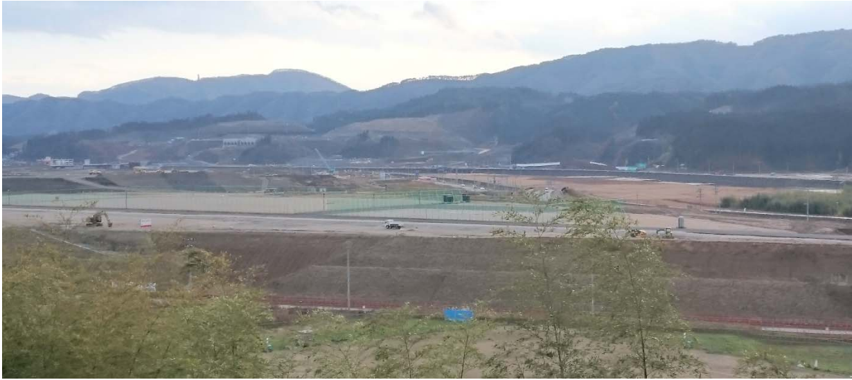
高田市内の嵩上げの様子です。