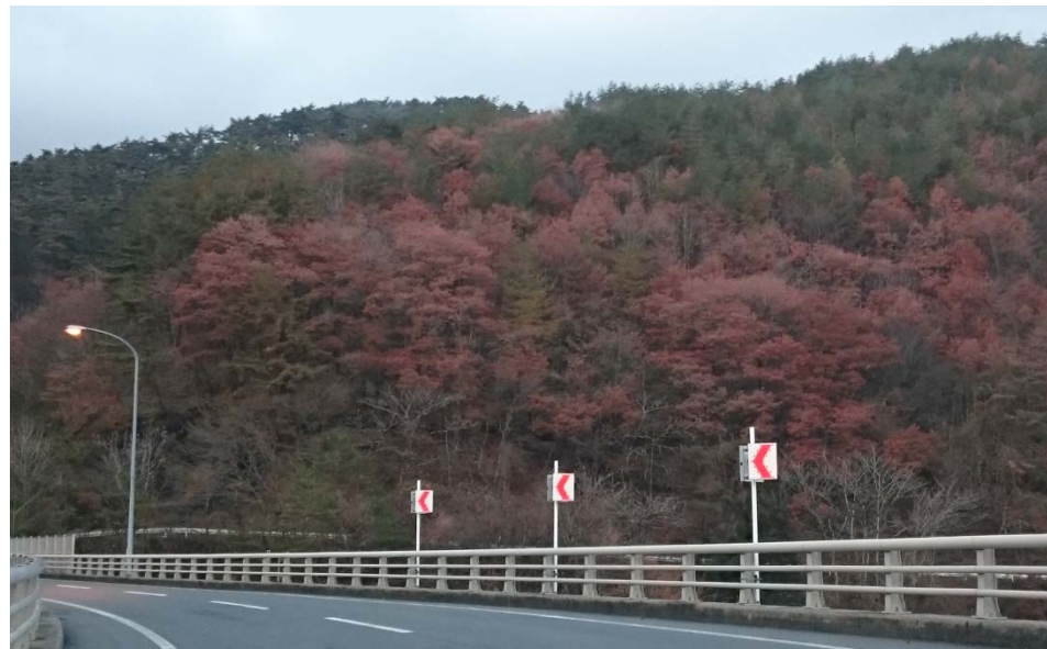
帰り道ループ橋から紅葉が観られました。