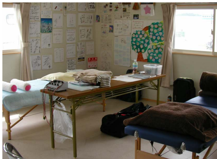
滝の里工業団地仮設住宅集会所