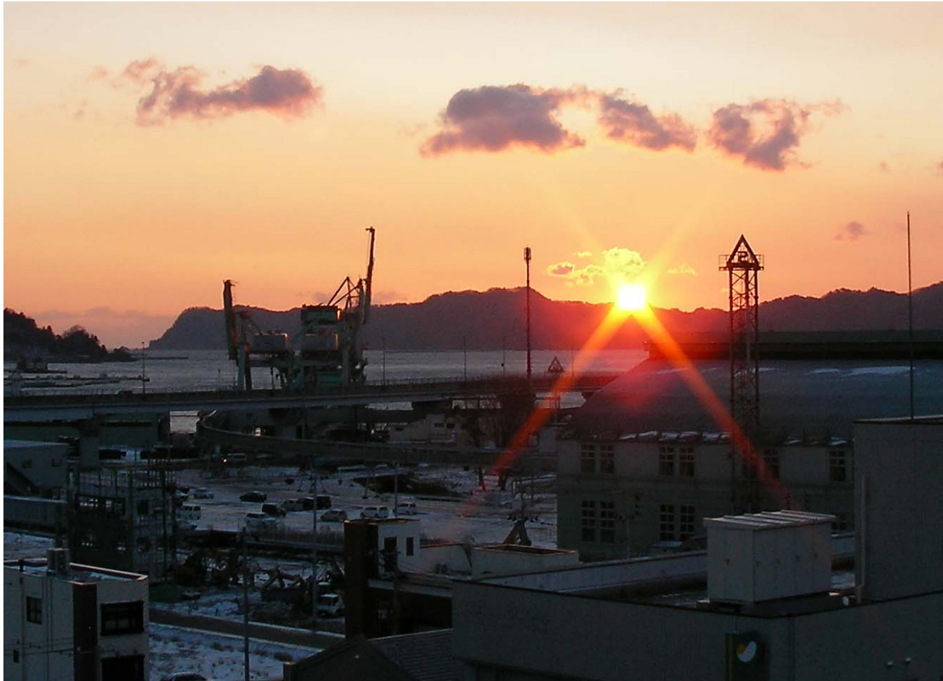
釜石市内からの朝陽です。きれいです。