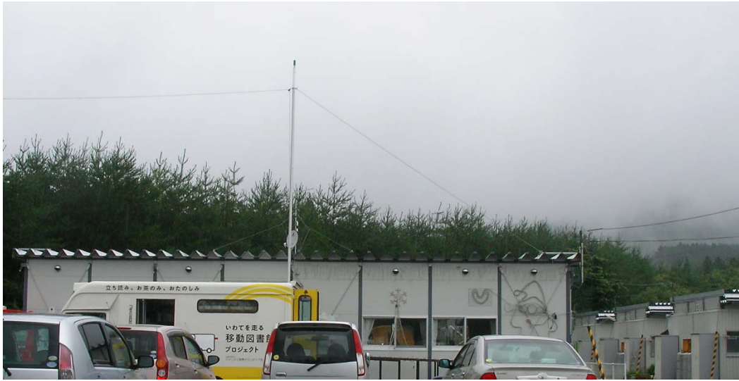
午前中、集会場に移動図書館が来ていました。