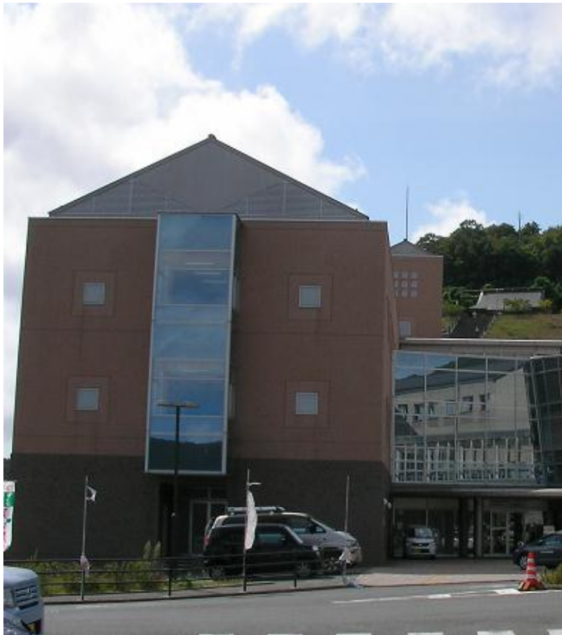
女川町地域福祉センター (町立病院内)高齢者福祉住宅 * 24年5月20日以来2回目の来訪