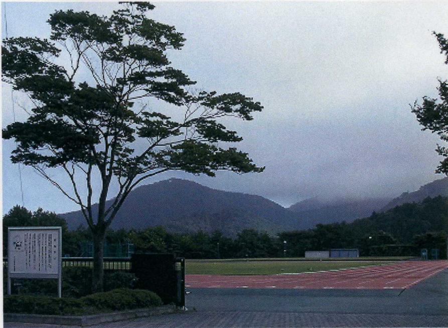
運動グラウンド陸上競技場

昨日のからの台風12号の影響で女川港が冠水していないか心配でしたが、冠水防止工事が行われ道路が盛土されていたので通行できました。女川は、雨はそれ程降らなかったようですが、空もどんよりしてお盆の頃の暑さはなく、秋模様を感じました。