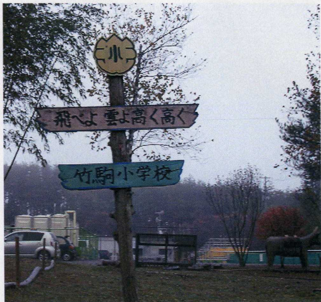
小学校入り口の案内