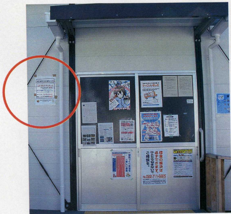
仮設住宅内集会所入り口へ 向かって左に貼った案内ポスター