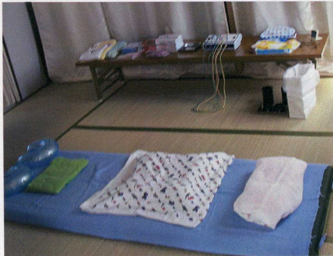
アコーディオンカーテンで仕切られた和室(6畳)

室内は、洋室(約30畳)、アコーディオンカーテンで仕切られた和室(6畳)、洋室(個室4畳)があり、トイレ、冷蔵庫。流し、エアコン、テレビ、が備えられている。