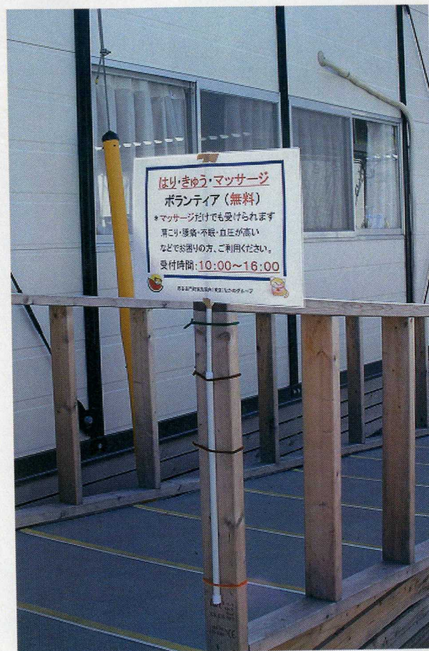
スロープ入り口の手すりへ 手作り看板を設置